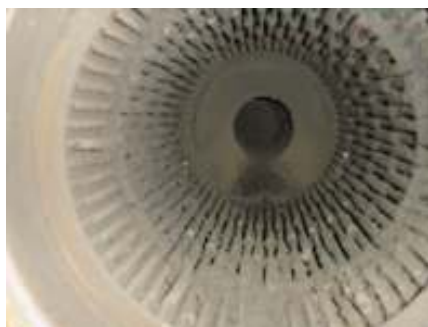
Zasajana oljna kurilna naprava